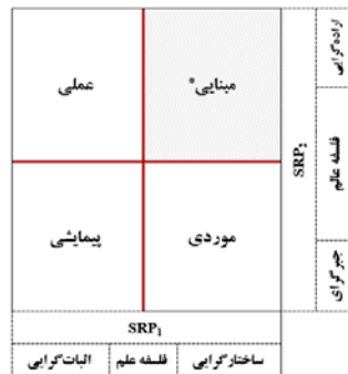
شکل ۲. ماتریس استراتژی های تحقیقی

در واقع به این دلیل مطالعه‌ی حاضر استقرائی محسوب می‌شود، چراکه به بررسی پدیده‌ای می‌پردازد که چارچوب جامع‌ایی در خصوص ماهیت استیلای گرای قدرت شرکای حسابرسی وجود ندارد و این مطالعه در تلاش برای تقویت و توسعه انسجام نظری در این حوزه می‌باشد. لازم به توضیح است که در طرح‌های اکتشافی، هدف شناسایی جنبه‌های گسترده و فراگیری از یک مفهوم مورد بررسی است که می‌تواند به توسعه سطح کارکردهای مفهوم کمک نماید. در واقع به دلیل اینکه پژوهش‌های منسجمی در حوزه‌ی شناخت شناسی رفتار هژمونیک (آمرانه‌ی) استیلای قدرت شرکای حسابرسی انجام نشده است و این مفهوم به میزان زیادی دارای ابهام در بستر حرفه حسابرسی می‌باشد، این پژوهش از طریق تحلیل داده بنیاد به دنبال بسط و توسعه‌ی تئوریک آن می‌باشد و براین مبنای ماهیت روش پژوهش اکتشافی تلقی می‌شود. لذا با اتکاء به رویکرد اشتراوس و کوربین (۱۹۹۸) در روش گزند تئوری، تلاش می‌شود تا از طریق مصاحبه با متخصصان امر، مباحث مربوط مشخص و دسته‌بندی شود. طبق این رویکرد، مقوله‌بندی چارچوب نظری در قالب یک مدل پارادایمی براساس ۵ بُعد شرایط علی، مداخله‌گر، زمینه‌ای، استراتژی‌ها و پیامدها می‌بایست تدوین گردد. همسو با ماهیت تشریح شده در انجام این مطالعه از نظر روش شناسی، برای شناسایی محورهای مدل پارادایمی پدیده مورد بررسی در این مطالعه، از مصاحبه استفاده می‌شود تا نسبت به شناسایی مضامین پدیده مورد بررسی، اقدام لازم صورت گیرد. معمولاً تعیین مبنای خبرگی برای انتخاب مصاحبه شونده‌گان، به دلیل تمایل یا عدم تمایل آنان برای مشارکت در انجام پژوهش در بخش کیفی، تا حد زیادی کارایی لازم اولیه را ندارد، چراکه ایجاد پروتکل مشخص برای رفت و برگشت فرآیندهای جمع‌آوری