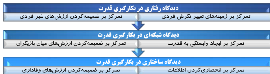
شکل ۱. کارکردهای نظری قدرت‌گرایی

رویکرد استیلا‌گرایانه، با نفوذ بر تصمیم‌های آنان، به دنبال حفظ منافع خود می‌باشند (طالب‌نیا و همکاران، ۲۰۱۲). بروز چنین اختلال‌هایی زمینه‌ی بسط نظریه‌های مختلف از قدرت را به حرفه حسابرسی مهیا نموده است. در یکی از نظریه‌های مرتبط با ساختار قدرت که هیل (۲۰۱۹) آن را مطرح نمود، هدف ارتقاء سطح شناخت از ماهیت اثرگذار محورهای ساختار قدرت در تصمیم‌های مدیریتی بوده است. هیل (۲۰۱۹) برای توسعه این مفهوم، سه کارکرد نظری از دیدگاه‌های قدرت‌گرایی را در قالب شکل (۱) مطرح نمود.