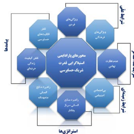
شکل ۴. محورهای مدل پارادایمی استیلای‌گرایی قدرت شرکای حسابرسی

در واقع استیلای‌گرایی قدرت شرکای حسابرسی گویایی این مسئله است که شیوه‌ی تعامل با حساب‌رسان به شدت می‌تواند تعارض‌آمیز و همراه با کاهش انگیزه‌های شغلی باشد. زیرا شرکای حسابرسی بر اساس رویکرد استیلای‌گرایی قدرت تلاش می‌کنند تا با تسلط بر جزئی‌ترین امور حرفه‌ای در ساختارهای مؤسسه و به واسطه‌ی سبک رهبری دستوری (آمرانه) حساب‌رسان را کنترل نمایند و این مسئله می‌تواند ریشه در ویژگی‌های فردی یا حتی فرهنگی جوامع مثل وجود ریشه‌های ارباب‌رعیتی در گذشته، داشته باشد. به عنوان مثال ویژگی فردی شریک دارای استیلای‌گرایی قدرت، رویکردی از ماکیاوِل‌گرایی رفتاری را نشان می‌دهد که سبب می‌شود تا شرکاء حسابرسی به دنبال جاه‌طلبی خود، حقوق حساب‌رسان را تضییع نمایند که این مسئله نوعی تملک‌طلبی ساختاری در سبک رهبری دستوری به حساب می‌آید. از طرف دیگر پذیرش نقش ارزش‌های فرهنگی مربوط به جایگاه شرکاء حسابرسی توسط حساب‌رسان شاغل در مؤسسه حسابرسی، عامل دیگری در بروز استیلای‌گرایی قدرت است که یادآور شیوه‌های نمایش یک طرفه‌ی قدرت‌سالاری بالادست بر زیردستانی است که مجبور به پذیرش فاصله‌ی قدرت و تصمیم‌گیری فردگرایانه، می‌باشد که باعث می‌شود حساب‌رسان در مؤسسه‌های حسابرسی صرفاً نقش اطاعت‌کننده‌ی اوامر را داشته باشند. اما نمی‌توان الزاماً این مسئله را به فرد یا فرهنگ نسبت داد، بلکه ارزش‌هایی همچون اعتماد در بسترهای اجتماعی هستند که به ایجاد هویت حرفه‌ای در حسابرسی کمک می‌کنند و مانع از این می‌شوند تا حساب‌رسان به هر قیمتی با شرکاء تملک‌گرایی قدرت همکاری و تعامل داشته باشند. از طرف دیگر فقدان نظارت‌های نهادی مستمر بر رویکردهای شیوه‌ی رهبری شریک حسابرسی، چالشی است که