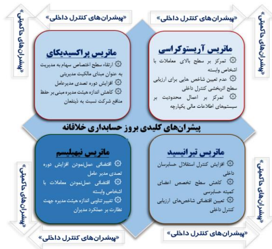
شکل ۸. ماتریس ارزیابی پیشران‌های کلیدی بروز حسابداری خلاقانه

هر ۴ ماتریس پیشران‌های کلیدی مؤثر در بروز حسابداری خلاقانه از طریق به کارگیری یک عبارت استعاره‌ای، توصیف شدند که در واقع نشان دهنده‌ی ماهیت مجموع مضامین قرار گرفته در آن سناریو بود. از طرف دیگر در راستای سوال سوم پژوهش، براساس ماتریس توابع ریاضی مشخص گردید، مهمترین سناریوی مرتبط با پیشران‌های کلیدی بروز حسابداری خلاقانه که می‌تواند مشروعیت اخلاقی گزارشگری مالی را تحت تأثیر قرار دهد، سناریوی ربع دوم ماتریس تیرانیسم، یعنی ضعف تمرکزگرایی ساختاری در اثربخشی کنترل داخلی می‌باشد. در راستای این نتیجه می‌بایست بیان نمود، سطح کنترل داخلی اولین جبهه‌ای از مواجهه با عملکردهای مالی شرکت‌ها است که می‌تواند با فیلتر نمودن هرگونه انحراف از واقعیت‌های عملکردی و رویه‌های گزارشگری مالی، امکان توسعه هنجاری پایبندی به رعایت حقوق ذینفعان را تقویت نماید. اما با اعمال نفوذ مدیران بر حسابرسان داخلی از طریق نفوذ و روابط دستوری، استقلال این واحد کاهش می‌یابد و این واحد مهم از فرآیندهای کنترل داخلی، اثربخشی خود را از دست می‌دهد. از طرف دیگر عدم انتصاب افراد متخصص در کمیته‌های حسابرسی و یا اخراج متخصصان کمیته‌های حسابرسی در کنار تعیین معیارهای خود خواسته ارزیابی کنترل داخلی، از جمله مضامین دیگری است که می‌تواند جنبه‌های مختلف مشروعیت گزارشگری مالی به ویژه از منظر اخلاق‌گرایی حرفه‌ای و پایبندی به ارزش‌های حقوقی ذینفعان را در آینده تحت تأثیر قرار دهد.