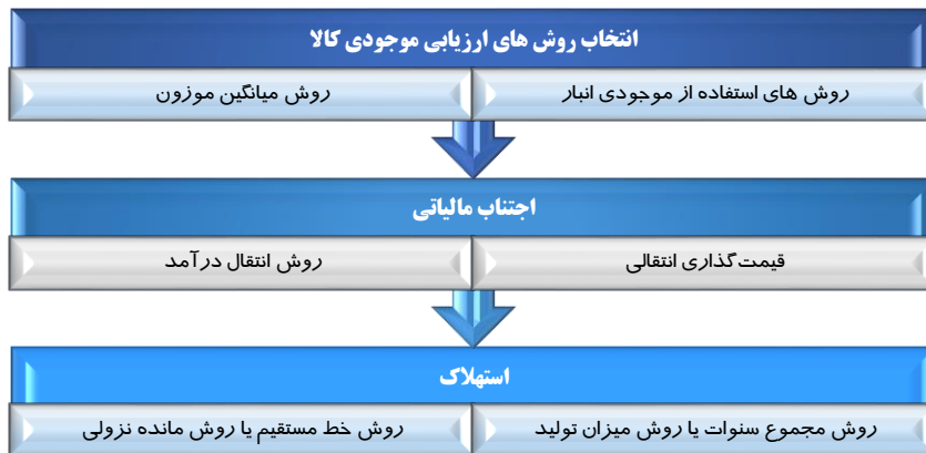
شکل ۳. برخی از رویکردهای اجرای حسابداری خلاق

میان روش‌های موجود استهلاک در تعیین هزینه استهلاک سالانه؛ اجتناب مالیاتی به واسطه شناسایی هزینه‌های تحقیق و توسعه و یا انتخاب روش‌های ارزیابی موجودی کالا که به بیش ارزش‌گذاری منجر می‌شود می‌تواند مبنای کاربردی حسابداری خلاق تلقی گردد.