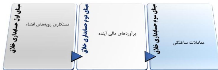
شکل ۴. مبنای اجرای حسابداری خلاقانه

از طرف دیگر صالح و همکاران ۱ (۲۰۲۱) دلایل ترویج و ترغیب مدیریت به استفاده از حسابداری خلاقانه را شامل نشان دادن یک روند ثابت رشد در سود یا همان هموارسازی سود جهت کمک به دستیابی تحلیلگران مالی به پیش‌بینی رضایت بخش؛ پنهان کردن اخبار بد و حفظ پایداری قیمت سهام می‌داند. از طرف دیگر طبق رویکرد امامت و همکاران (۱۹۹۹)، مبنای اجرای حسابداری خلاق را می‌توان در چارچوب زیر و براساس سه حوزه مورد توجه قرار داد.