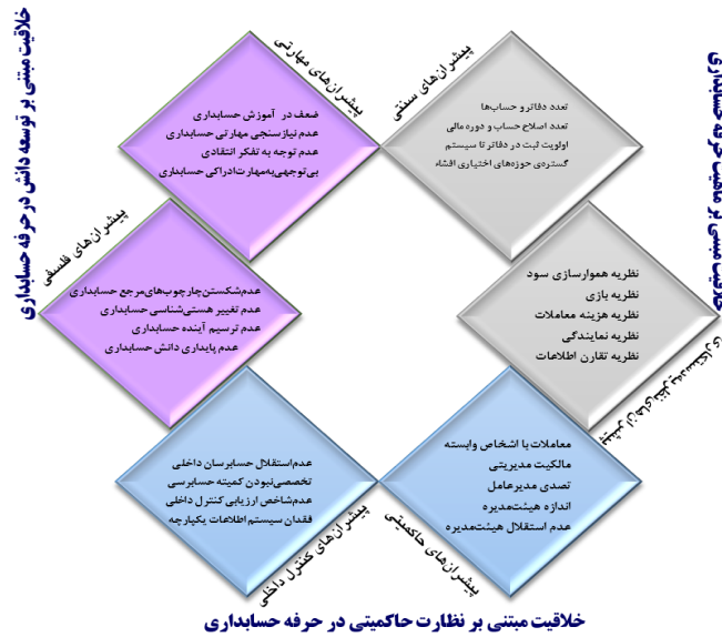
شکل ۶. چارچوب حسابداری خلاق

باتوجه به چارچوب نظری پژوهش همانطور که مشخص است، این چارچوب شامل ۳ مضمون فراگیر و ۶ مضمون سازمان دهنده و ۲۶ مضمون پایه مفهومی می‌باشد که طبق جدول (۶) می‌توان نحوه تفکیک و درصد فراوانی سه مرحله کدگذاری نیز مشخص شود.