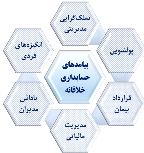
شکل ۲. پیامدهای حسابداری خلاق

به دلیل فقدان چارچوب نظری، در بستر دانش حسابداری، نوظهور تلقی می‌شود و زمینه‌های اثرگذاری آن در تحریف‌های مالی شرکت‌ها چندان ملموس نمی‌باشد. هدف اصلی برای ایجاد حسابداری خلاقانه «تحریف واقعیت‌ها از طریق دستکاری سود و یا هزینه‌های شرکت» می‌باشد که باهدف برآورده ساختن منافع تملک‌طلبانه‌ی گروهی از افراد دارای قدرت صورت می‌گیرد. سوسماس و درمیرهان (۲۰۲۰) اهداف حسابداری خلاق را به ترتیب زیر ارائه دادند.