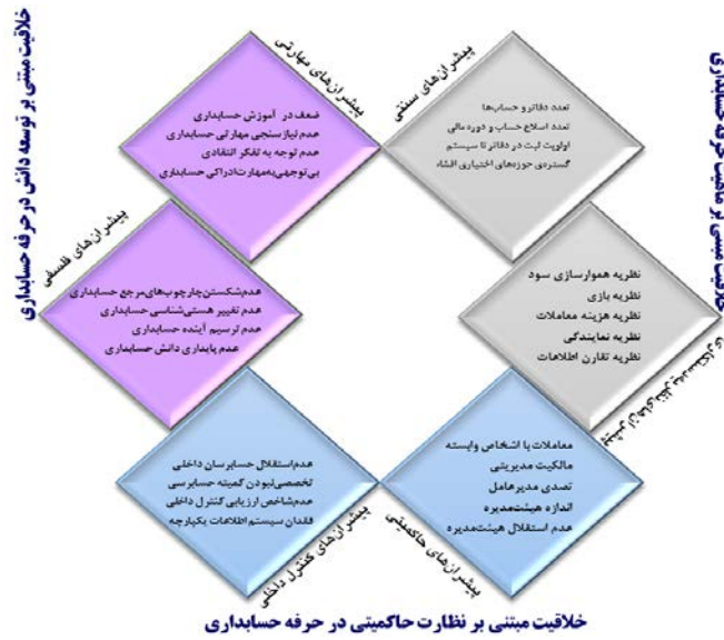
شکل ۶. چارچوب حسابداری خلاق

باتوجه به چارچوب نظری پژوهش همانطور که مشخص است، این چارچوب شامل ۳ مضمون فراگیر و ۶ مضمون سازمان دهنده و ۲۶ مضمون پایه مفهومی می‌باشد که طبق جدول (۶) می‌توان نحوه تفکیک و درصد فراوانی سه مرحله کدگذاری نیز مشخص شود.