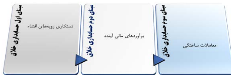
شکل ۴. مبنای اجرای حسابداری خلاقانه (منبع: امامت و همکاران، ۱۹۹۹)

از طرف دیگر صالح و همکاران ۱ (۲۰۲۱) دلایل ترویج و ترغیب مدیریت به استفاده از حسابداری خلاقانه را شامل نشان دادن یک روند ثابت رشد در سود یا همان هموارسازی سود جهت کمک به دستیابی تحلیلگران مالی به پیش‌بینی رضایت بخش؛ پنهان کردن اخبار بد و حفظ پایداری قیمت سهام می‌داند. از طرف دیگر طبق رویکرد امامت و همکاران ۲ (۱۹۹۹)، مبنای اجرای حسابداری خلاق را می‌توان در چارچوب زیر و براساس سه حوزه مورد توجه قرار داد.