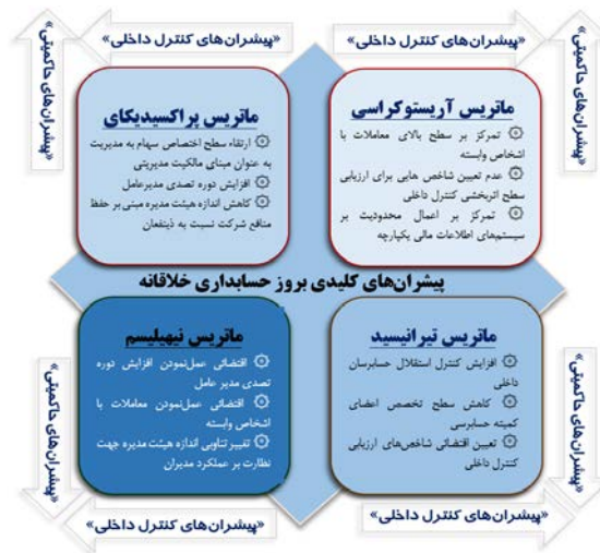
شکل ۸. ماتریس ارزیابی پیشران‌های کلیدی بروز حسابداری خلاقانه

هر ۴ ماتریس پیشران‌های کلیدی مؤثر در بروز حسابداری خلاقانه از طریق به کارگیری یک عبارت استعاره‌ای، توصیف شدند که در واقع نشان دهنده‌ی ماهیت مجموع مضامین قرار گرفته در آن سناریو بود. از طرف دیگر در راستای سوال سوم پژوهش، براساس ماتریس توابع ریاضی مشخص گردید، مهمترین سناریوی مرتبط با پیشران‌های کلیدی بروز حسابداری خلاقانه که می‌تواند مشروعیت اخلاقی گزارشگری مالی را تحت تأثیر قرار دهد، سناریوی ربع دوم ماتریس تیرانیسید، یعنی ضعف تمرکزگرایی ساختاری در اثربخشی کنترل داخلی می‌باشد. در راستای این نتیجه می‌بایست بیان نمود، سطح کنترل داخلی اولین جبهه‌ای از مواجهه با عملکردهای مالی شرکت‌ها است که می‌تواند با فیلتر نمودن هرگونه انحراف از واقعیت‌های عملکردی و رویه‌های گزارشگری مالی، امکان توسعه هنجاری پایبندی به رعایت حقوق ذینفعان را تقویت نماید. اما با اعمال نفوذ مدیران بر حسابرسان داخلی از طریق نفوذ و روابط دستوری، استقلال این واحد کاهش می‌یابد و این واحد مهم از فرآیندهای کنترل داخلی، اثربخشی خود را از دست می‌دهد. از طرف دیگر عدم انتصاب افراد متخصص در کمیته‌های حسابرسی و یا اخراج متخصصان کمیته‌های حسابرسی در کنار تعیین معیارهای خود خواسته ارزیابی کنترل داخلی، از جمله مضامین دیگری است که می‌تواند جنبه‌های مختلف مشروعیت گزارشگری مالی به ویژه از منظر اخلاق‌گرایی حرفه‌ای و پایبندی به ارزش‌های حقوقی ذینفعان را در آینده تحت تأثیر قرار دهد.