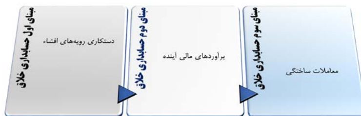
شکل ۴. مبنای اجرای حسابداری خلاقانه

از طرف دیگر صالح و همکاران ۱ (۲۰۲۱) دلایل ترویج و ترغیب مدیریت به استفاده از حسابداری خلاقانه را شامل نشان دادن یک روند ثابت رشد در سود یا همان هموارسازی سود جهت کمک به دستیابی تحلیلگران مالی به پیش‌بینی رضایت بخش؛ پنهان کردن اخبار بد و حفظ پایداری قیمت سهام می‌داند. از طرف دیگر طبق رویکرد امامت و همکاران ۲ (۱۹۹۹)، مبنای اجرای حسابداری خلاق را می‌توان در چارچوب زیر و براساس سه حوزه مورد توجه قرار داد.